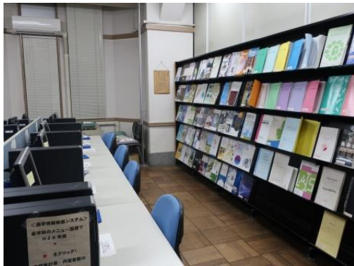
進学情報センター 資料室 (出入り自由)