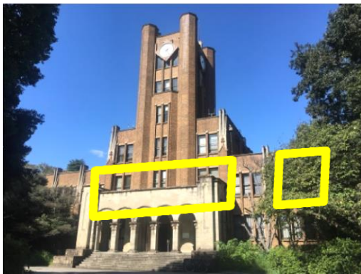
1号館2階 160 (資料室・相談室)、158 (相談室)