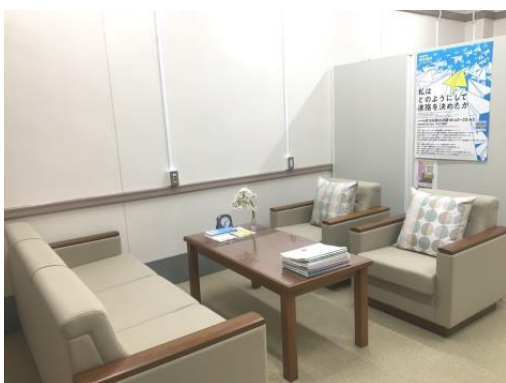
進学情報センター 相談室 (予約優先)