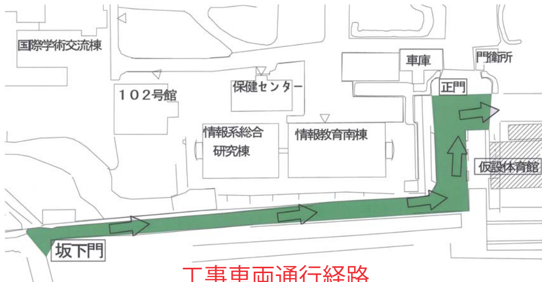
工事車両通行経路