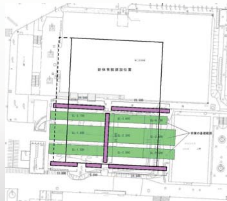
トレンチ（ピンク色の帯）を掘削 遺跡の確認を行います

東京大学埋蔵文化財調査室は2018年3月5日から一ヶ月間、駒場新体育館建設建設予定地で遺跡の確認調査を行っています。隣接する駒場コミュニケーションプラザの調査では旧石器、縄文時代の遺跡を調査しました。