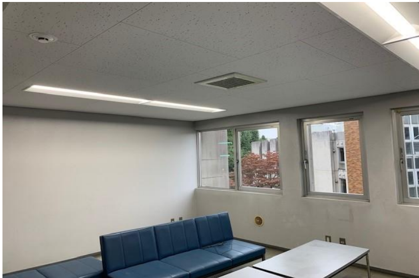
共用棟 多目的ホール内