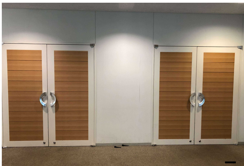
[室名サイネージ・インフォメーションボード]