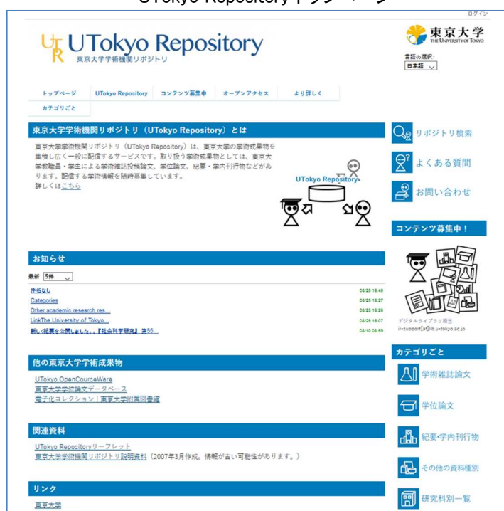
UTokyo Repository トップページ

( https://repository.dl.itc.u-tokyo.ac.jp/ )