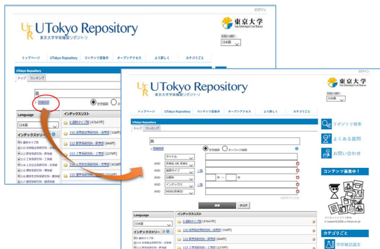
(閲覧・検索ページと詳細検索)

上部メニューの「UTokyo Repository」又は右上の「リポジトリ検索」をクリックすると閲覧・検索のページへ移動します。このページの簡易検索では、フルテキストを含む全ての項目に対する検索を行います(全てのコンテンツがフルテキスト検索可能ではありません)。「詳細検索」をクリックすると、キーワード(フルテキスト)、著者、タイトルなどの項目を限定して検索することが可能です。