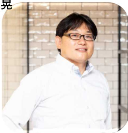
CDO Club Japan 理事・事務総長