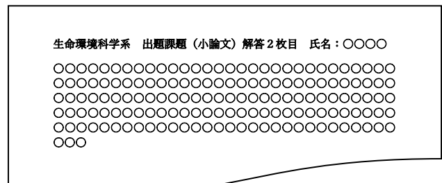
解答用紙 1 枚目および 2 枚目の冒頭イメージ図