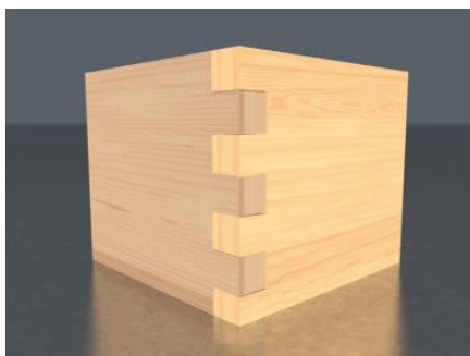
図1. ほぞ。木に凹凸の切り込みを入れ、これらを噛み合わせることで釘や接着剤を使うことなく、家具などを作ることができ、このようにして作られるものは指物と呼ばれている。海外にも同様の技法があり、mortise and tenon と呼ばれている。