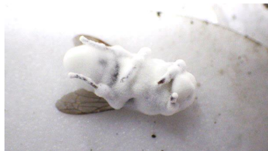
図 2: 糸状菌の塗布実験で死亡した働き蜂。死亡後に糸状菌が虫体を覆う。