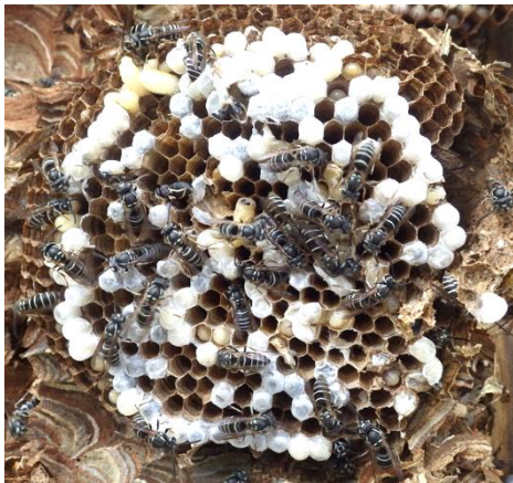
図 1: 幼虫と蛹、成虫が3密で生活するシダクロススズメバチの巣盤(外被は取ってある)。

家畜や農作物では、より多くの収量を得たり、成熟時期や品質を均一に揃えるために遺伝的に均一な個体を飼育、栽培しています。また、そのような遺伝的に均一な種を高密度で飼育、栽培することも多く、遺伝的に似通った生物が3密な状態にあり、疫病が爆発的に流行することがあります（鳥インフルエンザや、クローンのジャガイモ飢饉）。今回の研究からは、野生生物の遺伝的多様性と病原菌の進化を考える上で重要な知見が得られたと考えられます。