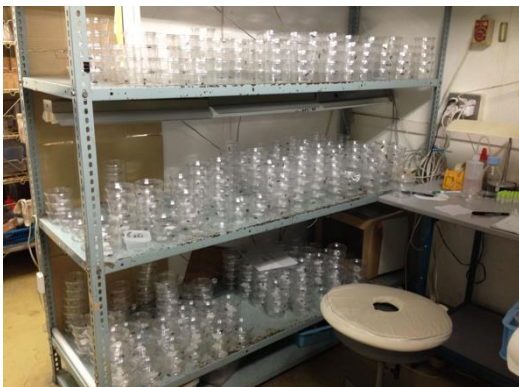
図 3: 個別飼育の様子。糸状菌を塗布した個体は温度一定の恒温室で個別飼育した。