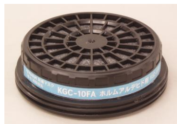
ホルムアルデヒド専用吸収缶 KGC-10FA

顔の動きにしなやかに追従、安定した装着感を得られ、顔とフィットしやすくなっています。